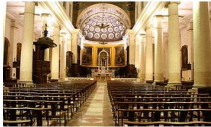
L'église Saint-Lazare située dans le 3 e arrondissement de Marseille au n o 13 de la rue Saint-Lazare. (*)